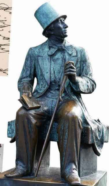
statue of H.C. Andersen statue af H.C. Andersen