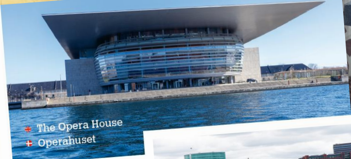
The Opera House Operahuset