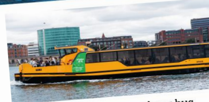
harbour bus havnebus