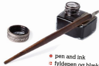
pen and ink fyldepen og blæk

H.C. Andersen blev født i Odense i 1805, hvor han boede indtil 1819, hvorefter han flyttede til København.