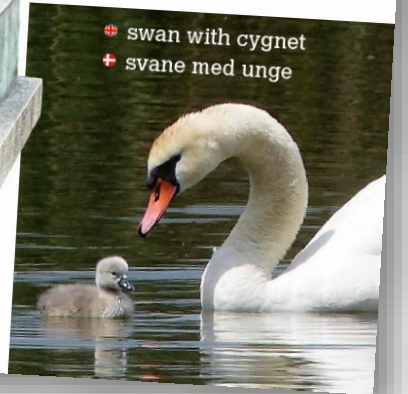
swan with cygnet svane med unge