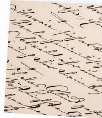
cursive writing skråskrift