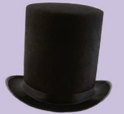
top hat høj hat